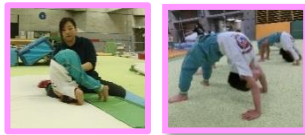
鉄棒・マット・跳箱の練習を行います